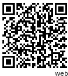
Video: A quoi sert la domotique

La démocratisation des nouveaux moyens de communications (smartphones, tablettes...) combinée aux innovations technologiques réalisées ces dernières années dans les appareils du quotidien ont fait apparaître une nouvelle manière de gérer et d'utiliser les équipements de son logement : la domotique. En plus de permettre des gains sur la facture d'énergie et une amélioration du confort pour le consommateur, elle présente des avantages pour le système électrique. .